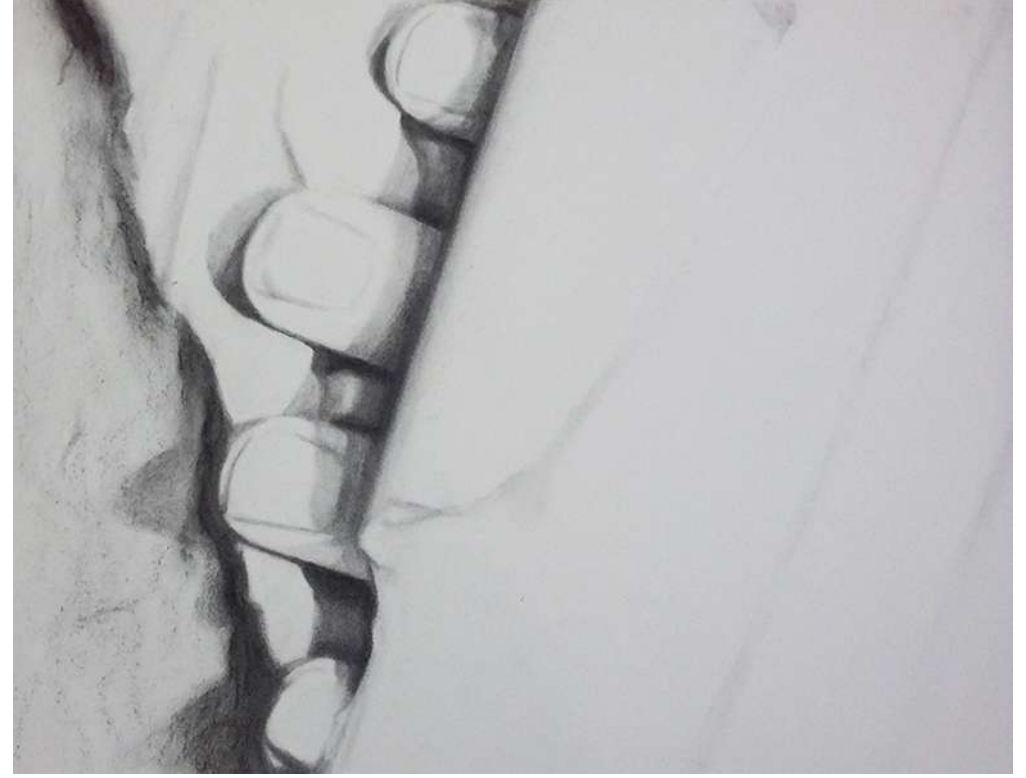
Les noces de Pirithoos - 2020