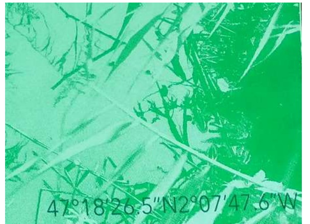
Les Fossés - 47°18'26.5"N 2°07'47.6"W -2021 Sérigraphie (encres vertes, dégradés et peinture phosphorescente)

D'après une enquête photographique menée dans la zone du port méthanier de Montoire-de-Bretagne. Recherche de micro paysage dans les fossés. Ici un fossé géolocalisé aux abords de l'usine d'engrais chimique Norvégienne Yara en juin 2020, Usine classée SEVESO , l'une des plus polluantes de l'estuaire de la Loire.