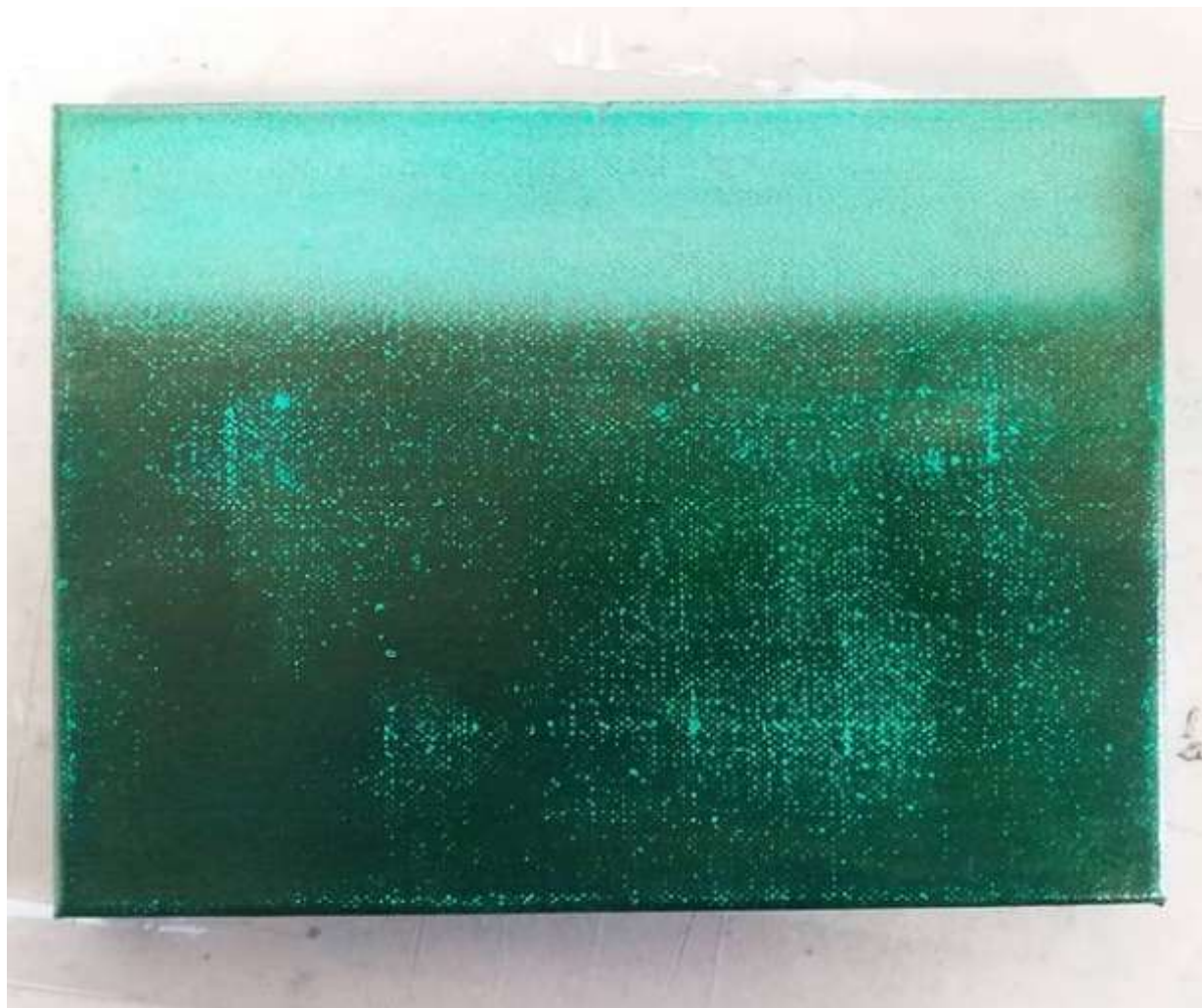
Le vert est une couleur instable 2021 Huile et pigment sur toile. 16X21cm