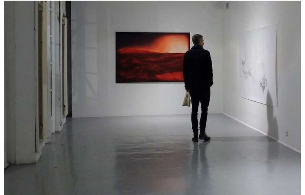
Teaser - 2019 Huile et acrylique sur toile 250 x 280 cm

Peinte d'après une photographie de coucher de soleil sur Mars transmise par Hubble, Teaser évoque, mais sans la reprendre une image apparaissant dans "Total Recall", le film de Paul Verhoeven sorti en 1990 et inspiré d'une nouvelle de Philip K. Dick. C'est une vision saturée, fantasmée, inspirée des phénomènes spatiaux qui sont recolorisés dans des laboratoires scientifiques