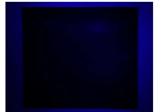
Vues de la peinture sous l'influence de la programmation lumineuse.