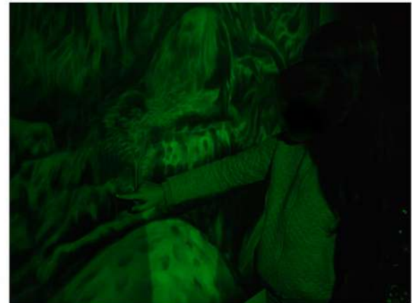
Vue de l'installation

Dans un espace totalement mis au noir, une programmation lumière très lente et de très faible intensité est projetée sur la peinture. La lumière varie lentement mais pas suffisamment ainsi l'oeil ne s'habitue pas à sa vitesse, il s'habitue uniquement à l'intensité au fur et à mesure des passages de la boucle qui dure 5 minutes.