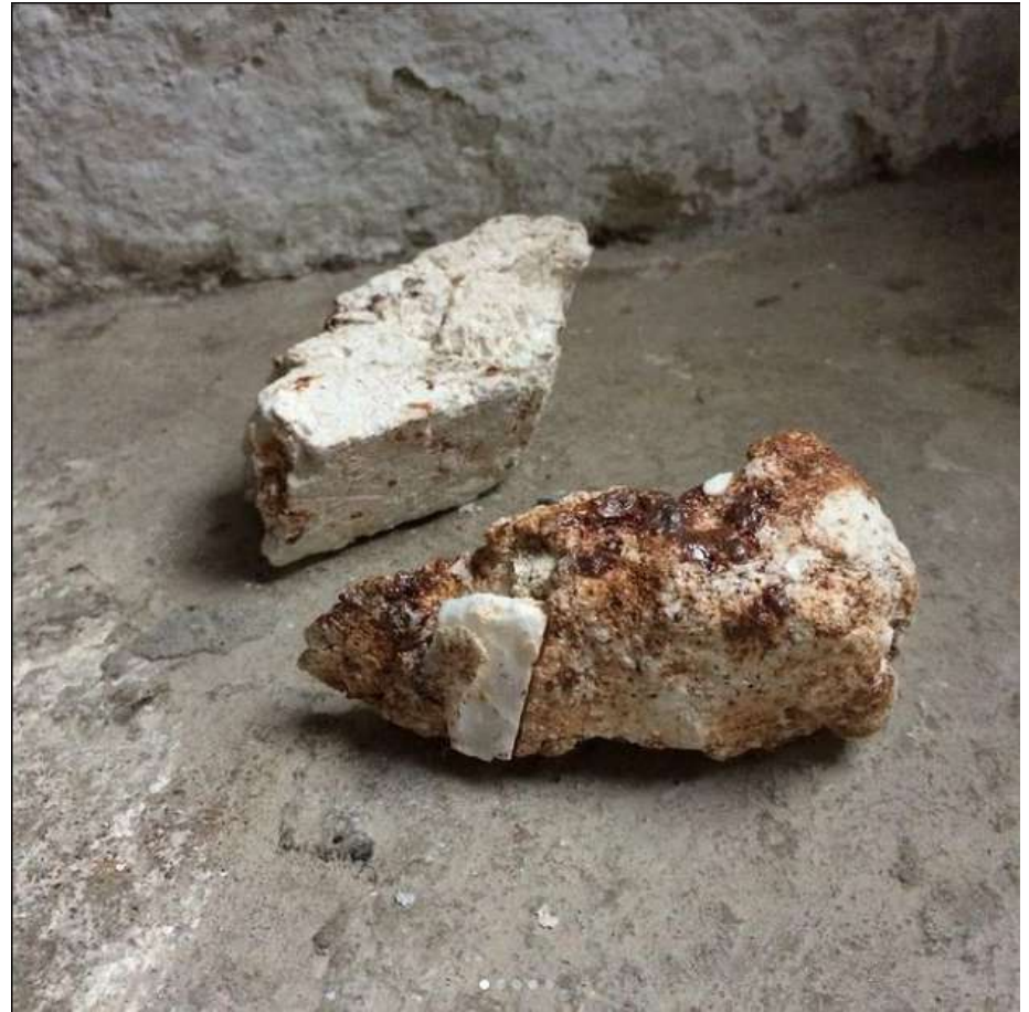
2021 Prélèvements du lit d'un fleuve fossile passé par le feu. Kaolin-quartz - micashistes - shistes rouges - silts