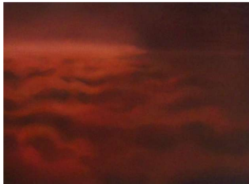
sans titre - 2019