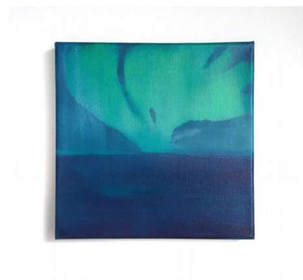
(sans titre) - 2019 Huile et acrylique sur toile 20 x 20 cm