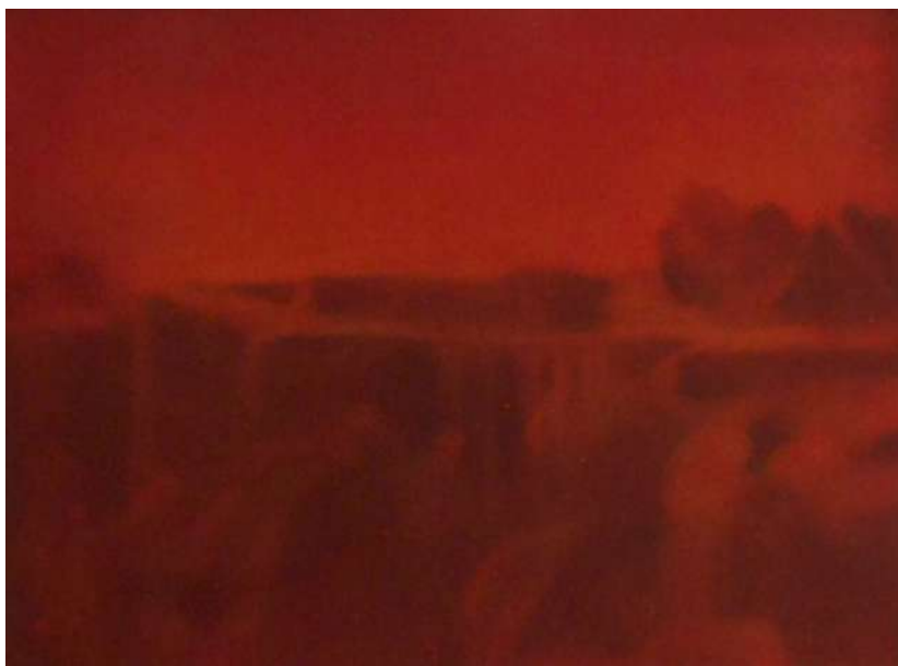
we can remember it for you wholesale - 2018