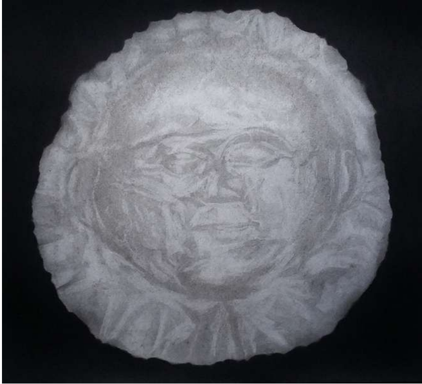
The Sun King - 2019